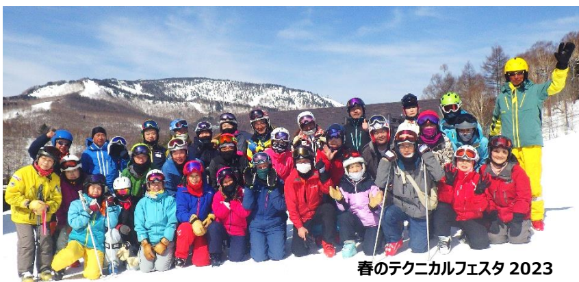
春のテクニカルフェスタ 2023

参加費をまとめて振込むことは可能です。その場合は申込み時に送られる受付メールアドレス宛に「振込み内訳（クラブ名、全員の名前、各自の金額など）」を記載したメールを必ず送付してください。