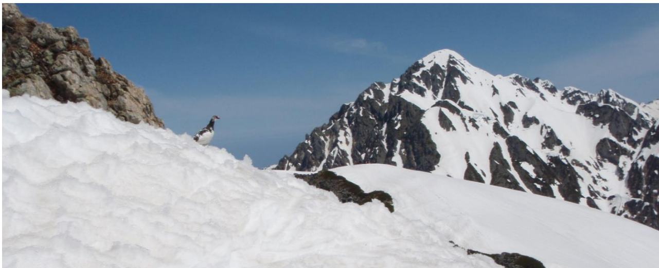
剣岳を正面に、これから剣沢への滑降が始まる