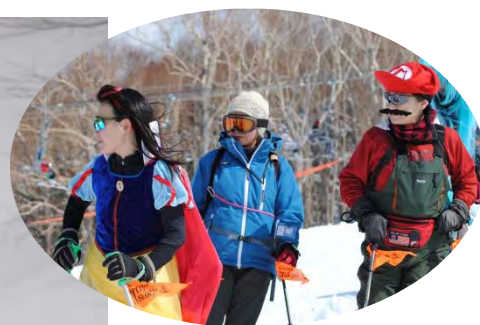
コスプレ組も健在