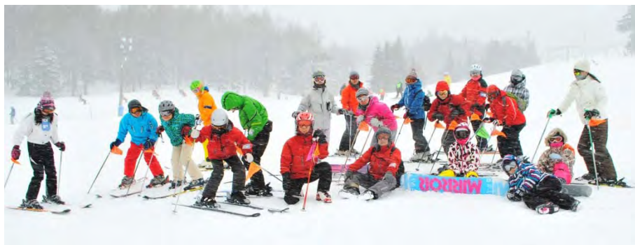
スキーもボードも一緒に楽しめます！