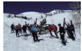
2013年5月 乗鞍岳山スキー全国交流