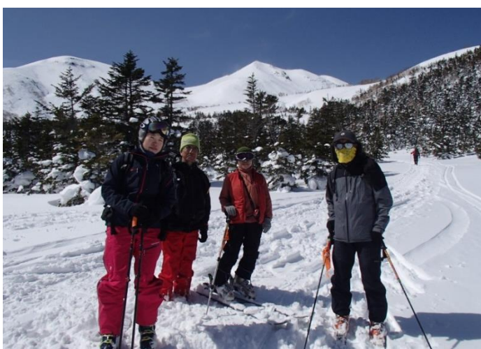
快晴の乗鞍をバックに

2 日目は快晴 乗鞍岳がクッキリ見える。前日とほぼ同じルートにトップを交代しながら進む。今日は遠望もきき、近くに奥穂高岳、中央アルプス、南アルプス、八ヶ岳、浅間山等々、山に詳しい参加者に山座同定をしていただく。