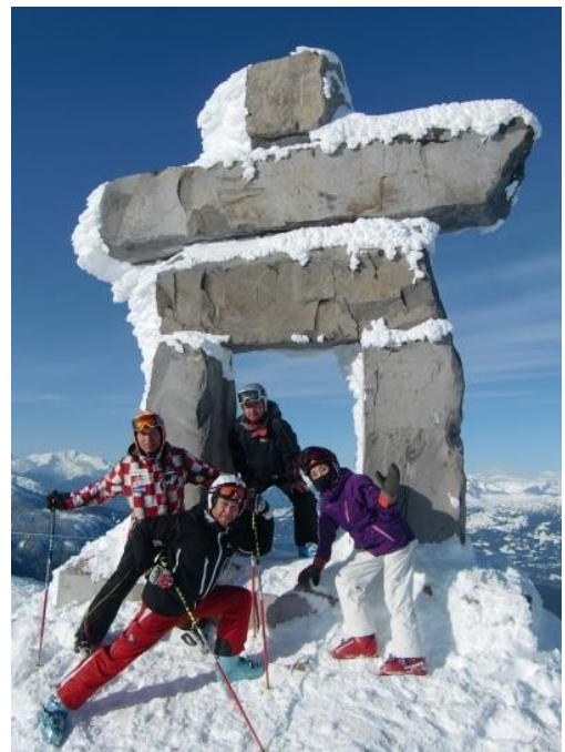
↑2014年3月、カナダスキーの1コマ ←今年1月、東京大会の表彰式で