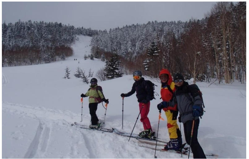
乗鞍岳山スキー教室・スタート

山スキーが初めての人に合わせ、ビンディング・歩行のコツ等をレクチャー。ビーコンチェックを行い最初の急登へ。キックターンを慎重にこなし、樹林帯の切り開かれた斜面へ、ここでハンドテストを行う。