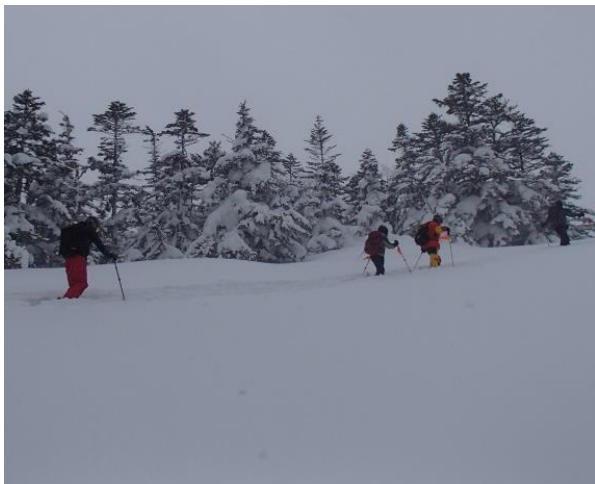
新雪の中、シール登高

15センチ及び40センチの所に弱層が有り、ナイフで雪を切った様にズレて一同感心する。