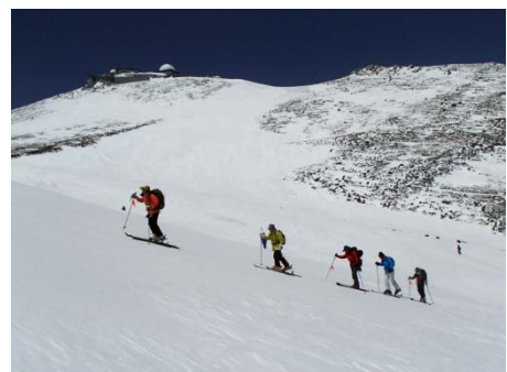
乗鞍岳(左上コロナ観測所)

乗鞍岳(標高3025m)山頂からの滑降目指し、大きな雪渓・素晴らしいオフピステです。