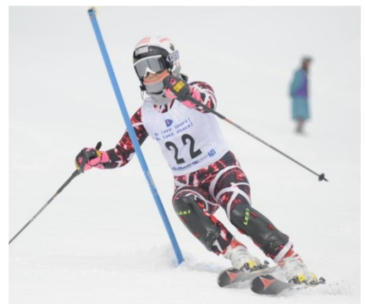
5クラブ合同八甲田パウダースキー