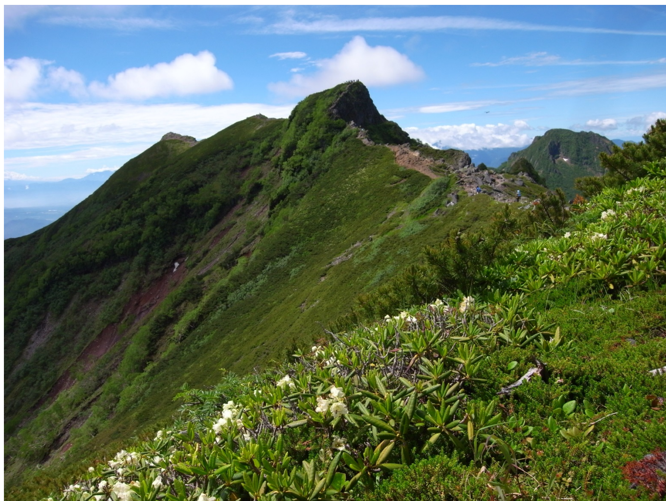
八ヶ岳、縦走路からの横岳