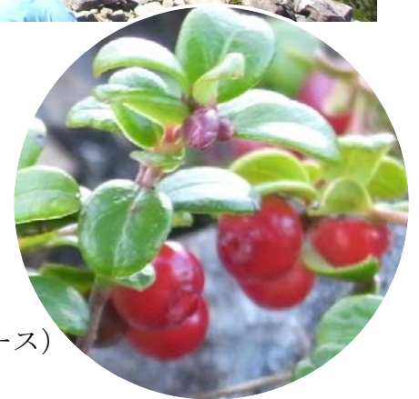
コケモモの赤い実