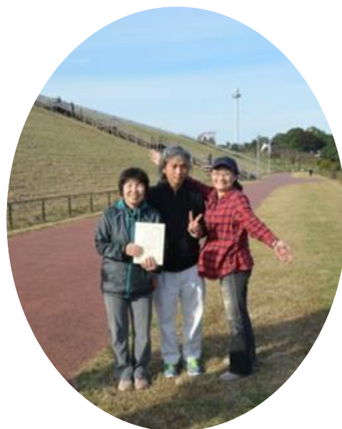
↑毎年10月のクラブ交流駅伝に参加しています。