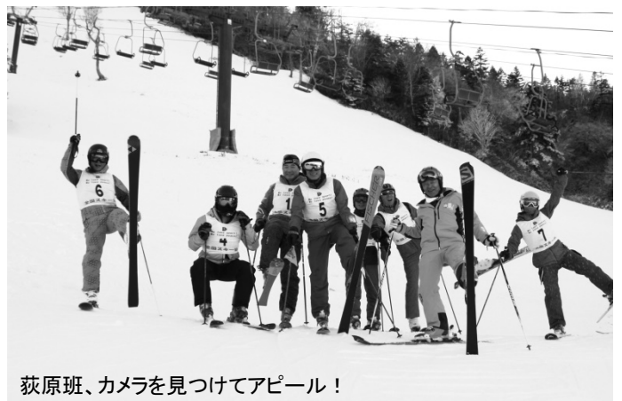
荻原班、カメラを見つけてアピール！