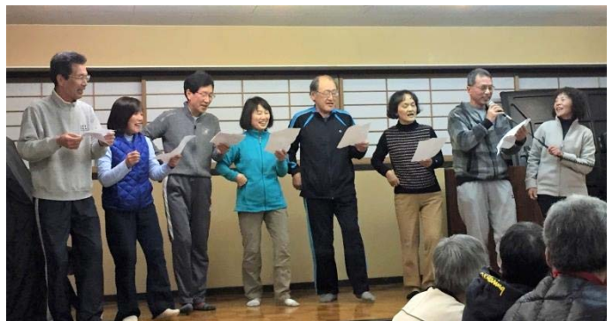
今年も参加したテクニカルフェスタの交流会で、歌でクラブの紹介。

① 2007年9月3日、22名で設立。2017年9月で10周年を迎えます。労山練馬区連盟スキー交流会の二次会で「山スキーをいつまでも楽しむにはグレンデでスキー技術を磨くことだ。安く学ぶにはスキー協に加盟する会を作ろう。」ということになったのがきっかけです。現在の会員数は、ちょうど50名です。