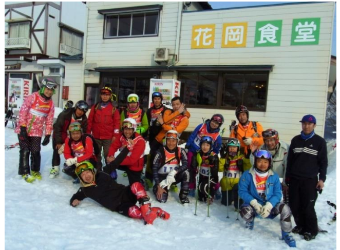
昨年のレッスンより