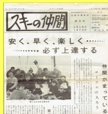
1972 年 1 月 スキーの仲間 5 号