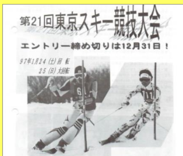
1996 年 11 月 175 号