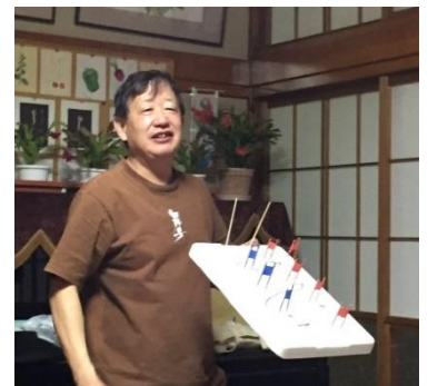
これが噂のミニチュアコース。ライン取りが書かれていて、“ビギナーにも分かりやすい”