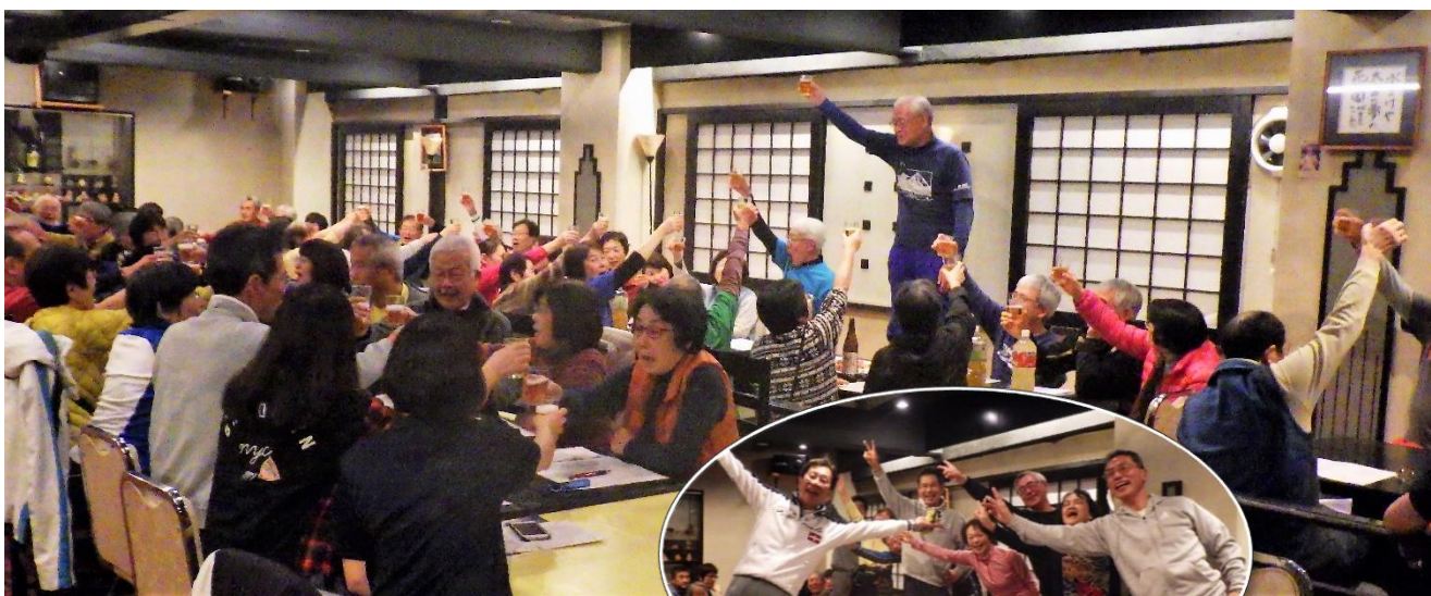
交流会も楽しく盛り上がりました

初日は応用研修、あとの2日は、改訂教程を中心にした講習を行いました。ポイントは、1. 外向でスキーはFL方向に滑る、2. 外傾を強めればエッジングが強められる。3. 宿でのミーティングでは、基本姿勢の確認。1. 腰を前に、2. 切り替え、3. 荷重。初歩パラ、ベーシックパラ、洗練パラと順次進めていくと、腰を前にと切り替えを同時に行うことを求められます。習熟するには相当な期間が必要かもしれないと感じていますが、みなさんと一緒に引き続き取り組んでいきたいと考えています。