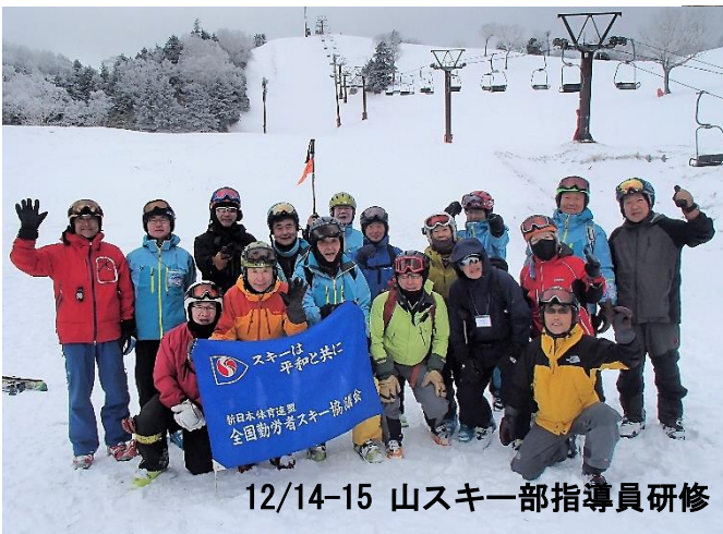
12/14-15 山スキー部指導員研修