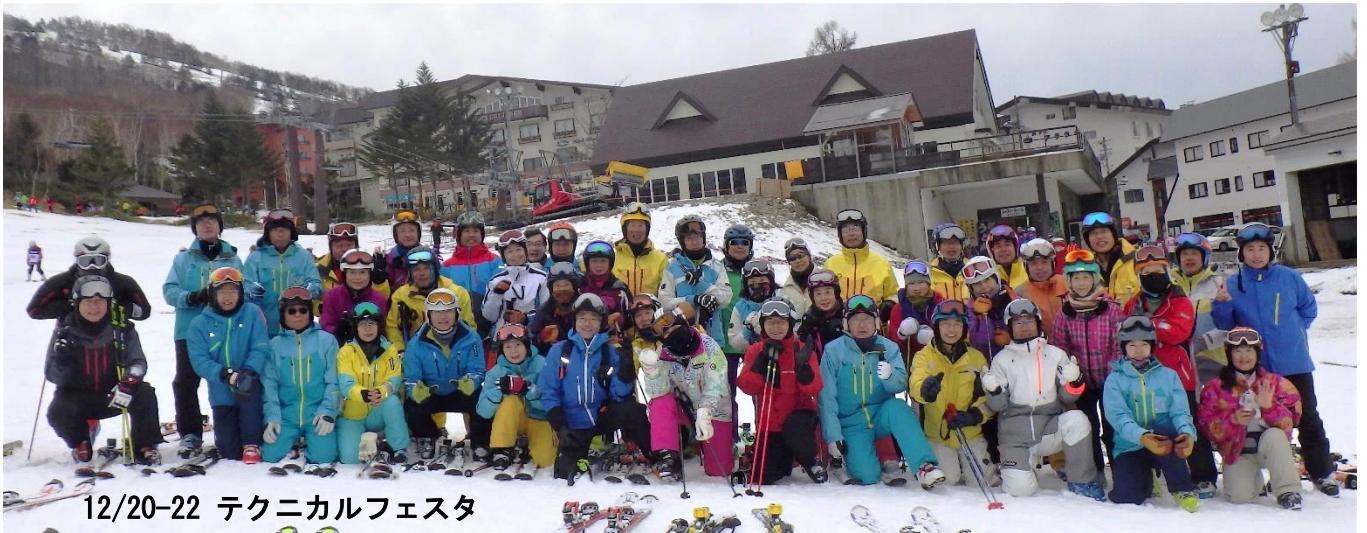
12/20-22 テクニカルフェスタ