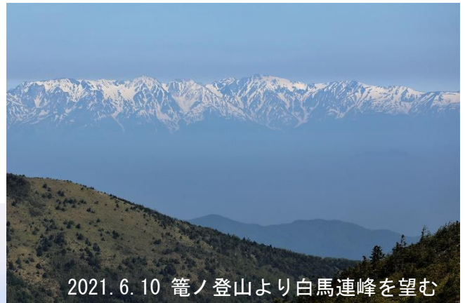
2021. 6. 10 箆ノ登山より白馬連峰を望む