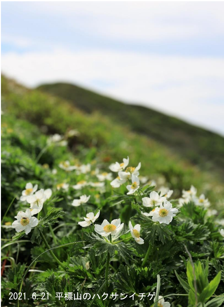
2021. 6. 21 平標山のハクサンイチゲ