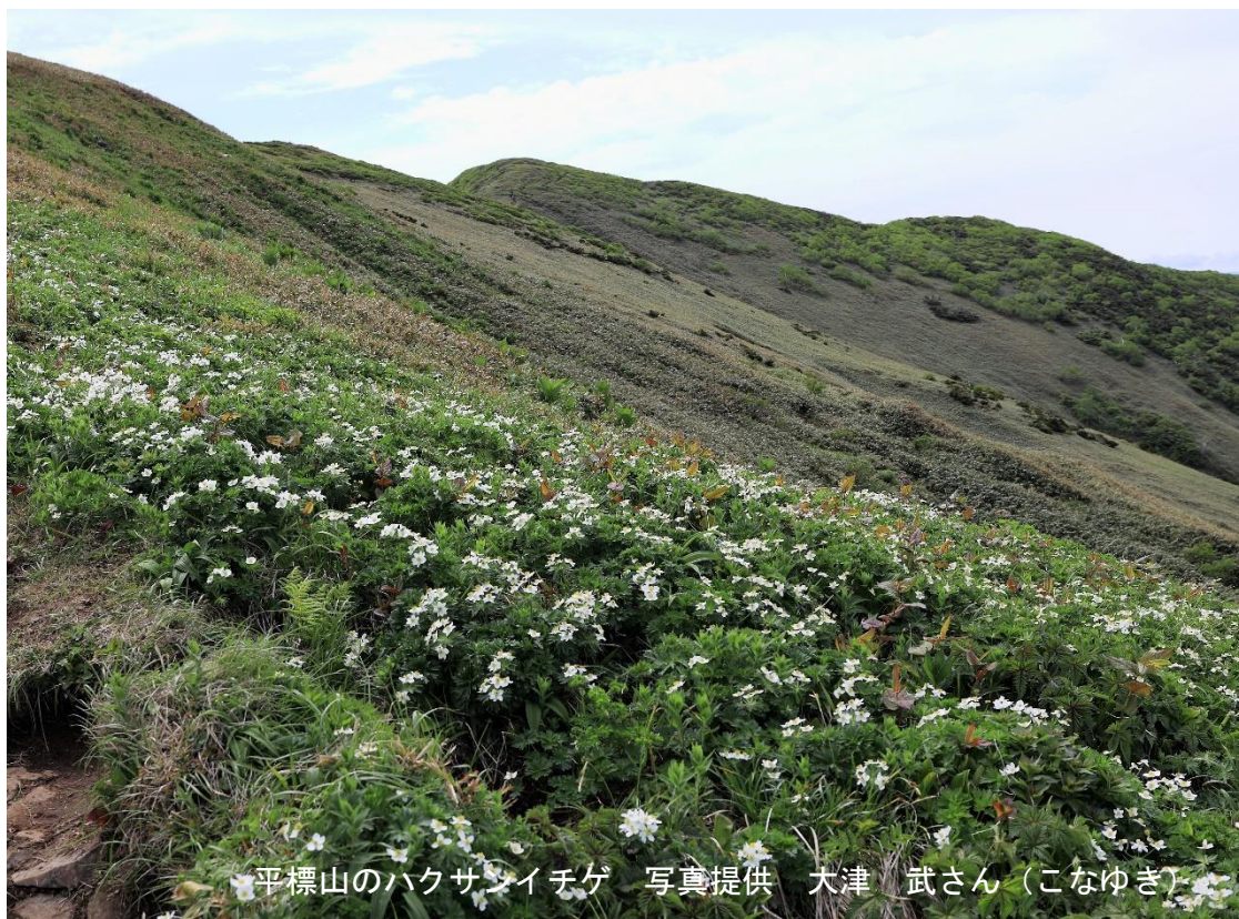
平標山のハクサンイチゲ

さて、今年は事務所の移転があります。公認資格者登録や会員登録・会費納入は8月20日が締め切りです。お忘れなきようお願いします。