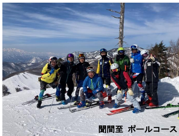
聞間至 ポールコース