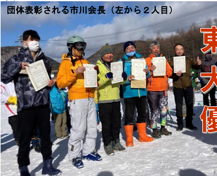
団体表彰される市川会長 (左から2人目)