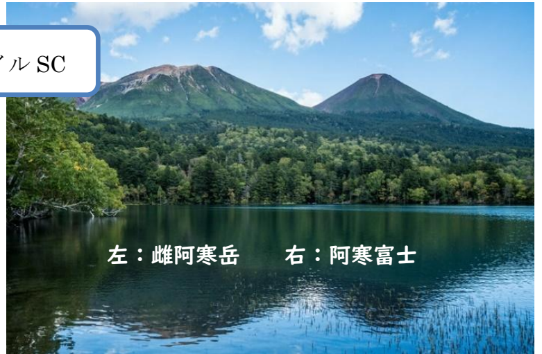
左：雌阿寒岳 右：阿寒富士