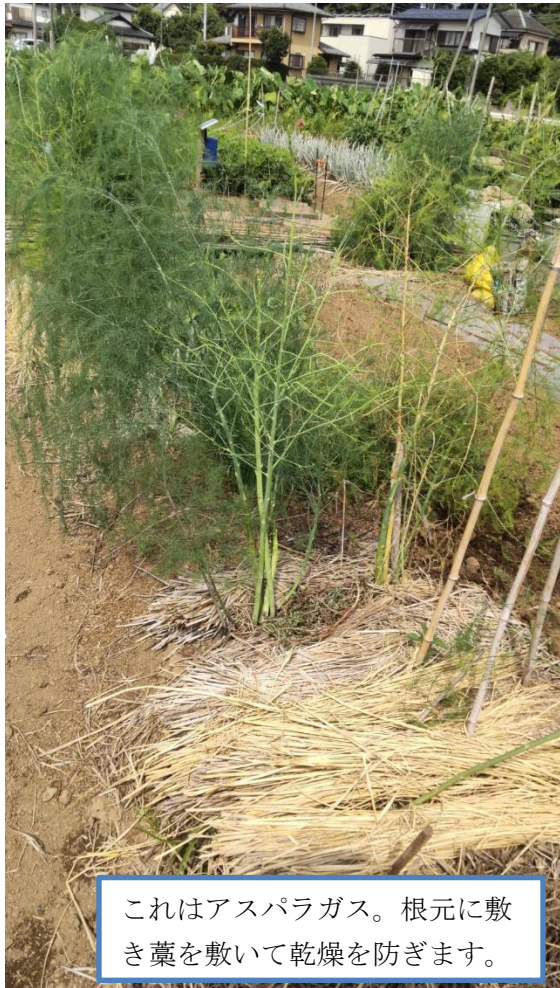
これはアスパラガス。根元に敷き藁を敷いて乾燥を防ぎます。